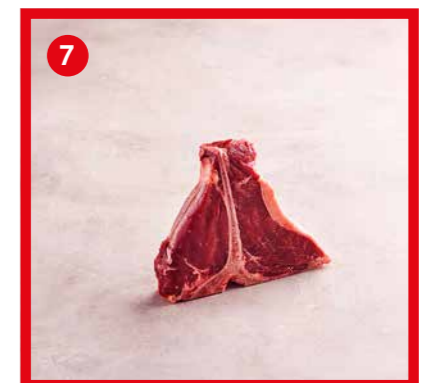
75548 | T-Bone (porterhouse) +/- 700 g