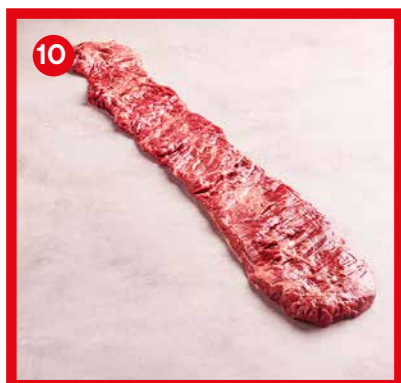
75551 | Hampe +/- 500 g x2