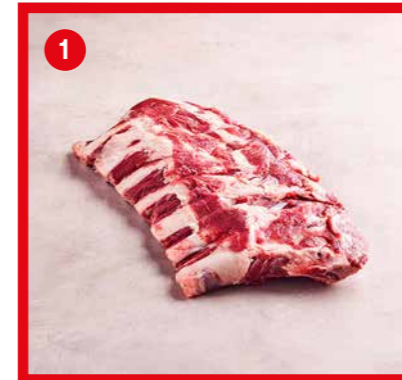
75546 | Back ribs +/- 1,2 kg