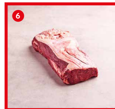
75541 | Faux-filet sans os +/- 2,3 kg