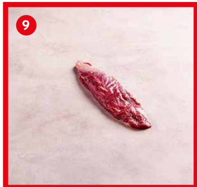
75540 | Surprise +/- 350 g x4