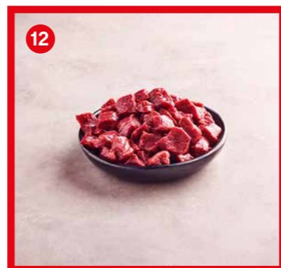
75539 | Cubes +/- 2,2 kg (+/- 10 g)