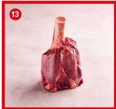
75545 | Hammer shank (jarret manchonné) +/- 1,9 kg