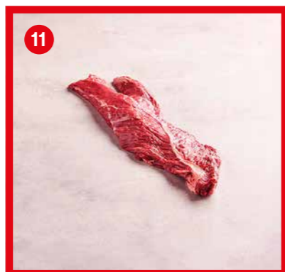
75542 | Onglet +/- 500 g x6