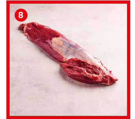
75550 | Filet sans chaînette +/- 1,5 kg