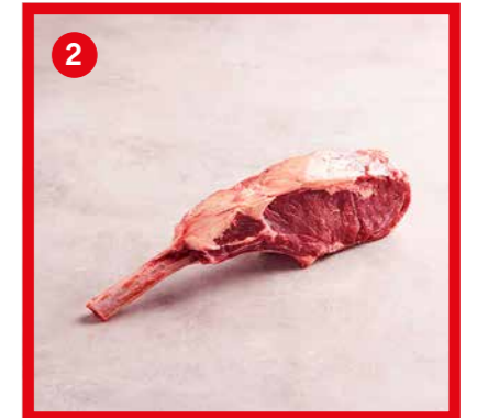
75547 | Tomahawk +/- 950 g