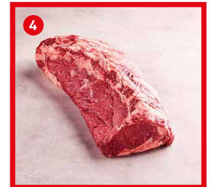
75544 | Noix d'entrecôte +/- 4 kg