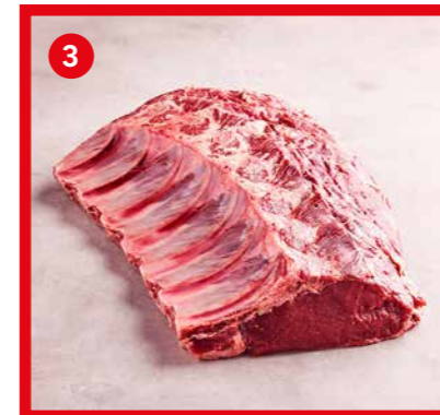
75551 | Carré de côtes +/- 6 kg