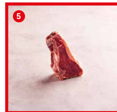
75552 | Faux-filet avec os +/- 450 g